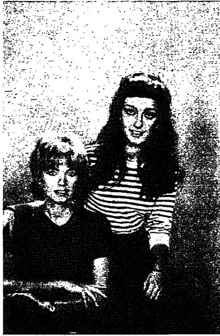
ولكن باسكال التي لاقت نجاحا كبيرا في هذا الفيلم، حطت خطوة اخرى نحو الشهرة والتألق مع فيلمها الجديد في ماريما الذي بدأ عرضه في ايلول الماضي.